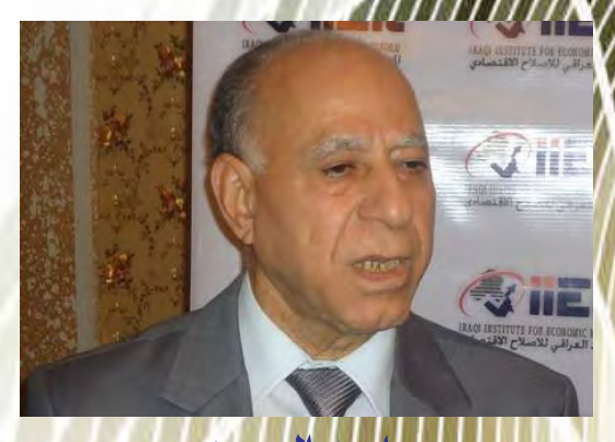
د. ما جد الصوري الأصلاح المصرفي في العراق وتحديات الأستثمار