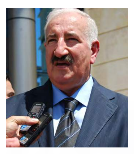
رسالة شكر من محافظ البنك المركزي وكالة الى رئيس رابطة المصارف الخاصة